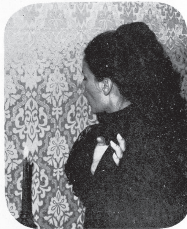
1967 - O Urso.