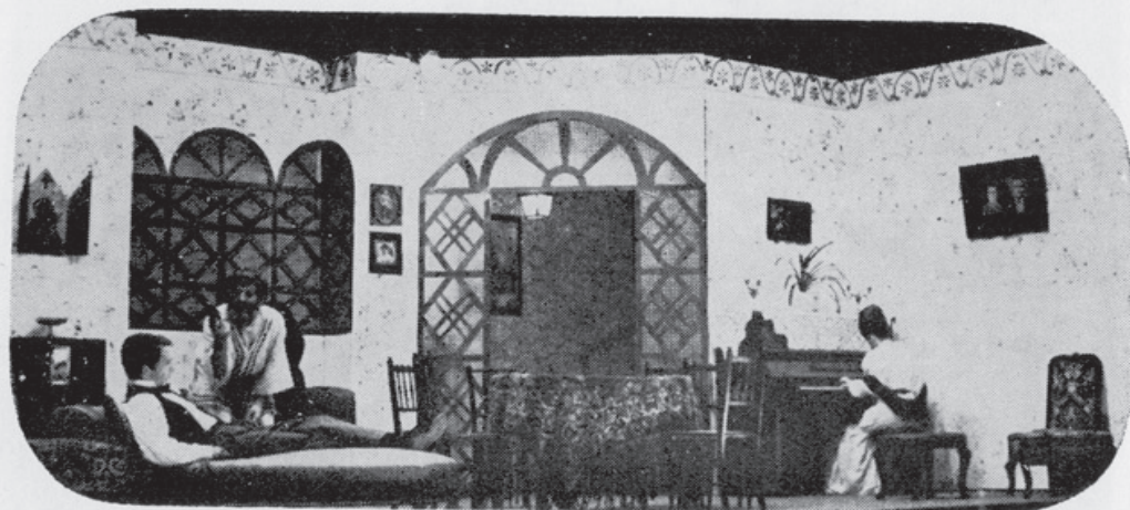
1969 - Pequenos Burgueses - Melhor espetáculo de 1969.