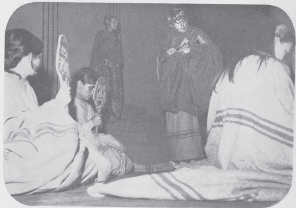
1968 - Electra.

fios & máquinas * cursos de tapeçaria tece-lã cirandinha * material de tricô e crochê gal. ítala, loja 10