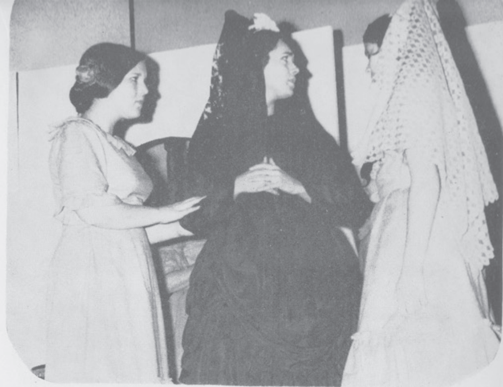
1968 - Bodas de Sangue.

nélson importações ltda. perfumes franceses marechal deodoro, 128