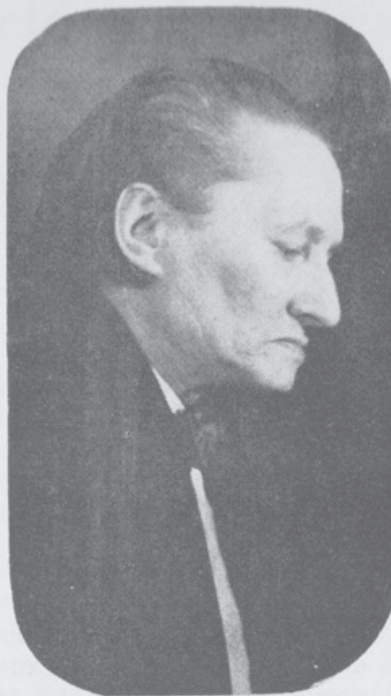
Michel de Ghelderode (1898/1962)