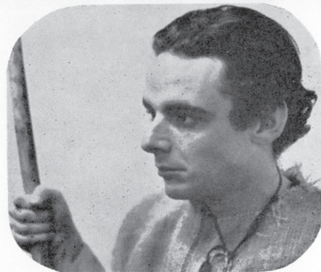
1967 - Cancioneiro de Lampião - Melhor espetáculo de 1967.

Ao completar cinco anos de existência marcados por um trabalho ininterrupto em prol da cultura e do teatro de Juiz de Fora, firme em seu propósito de difusão cultural e fazendo das palavras do Poeta Definitivo de Espanha, Federico Garcia Lorca "MEDE-SE A CULTURA DE UM POVO PELO SEU TEATRO", a diretriz de seu trabalho, o GRUPO DIVULGAÇÃO e o CENTRO DE ESTUDOS TEATRAIS já apresentou à cidade trabalhos antológicos, cursos, conferências e as seguintes encenações dramáticas: