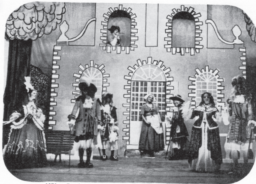
1970 — Escola de Mulheres — Melhor espetáculo de 1970.