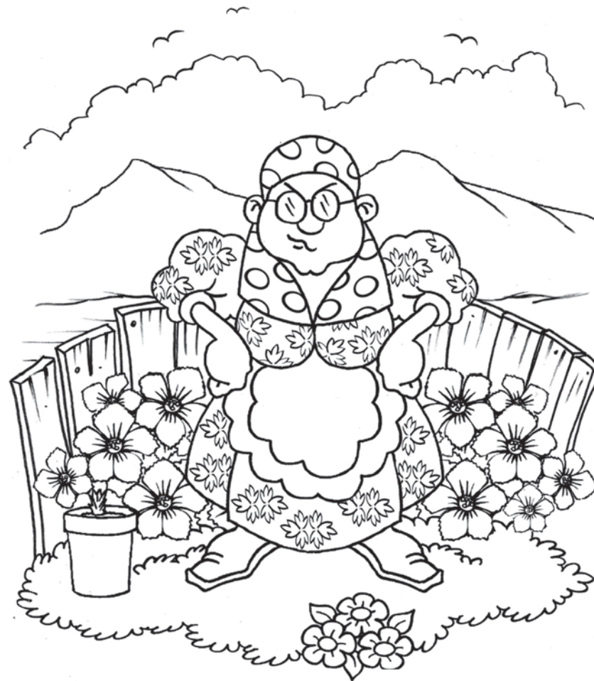
A Vêia Óia desconfiava da vaidade do Rei...

Um povo que canta É um povo feliz Quem muito planta Sabe o que diz Quem planta, come E alegre fica A fome some E se enche a barrica Temos orgulho do rei Quando passa elegante Fala tudo que não sei Ele é sempre brilhante Não podemos deixar Pois sempre nos ensinaram Que ao rei se deve amar Um rei sempre aclamaram Lá vem o rei a cavalo Nos campos a cavalgar O povo para e aplaude E volta pra trabalhar O rei cavalga com graça Lindamente vestido Esta figura sem jaça Sempre, sempre é aplaudido. Palmas pro Rei Pavão Que ele merece afinal Pois em nossa opinião Não existe rei igual Nosso reino é feliz Nosso rei é importante Ele é um grande juiz Ele é muito elegante Foi cavalgando adiante Deixando um rastro de luz Já vai o rei bem distante Rei Pavão, o elegante. Viva o Rei Pavão !!!! Vivaaaa!!!!