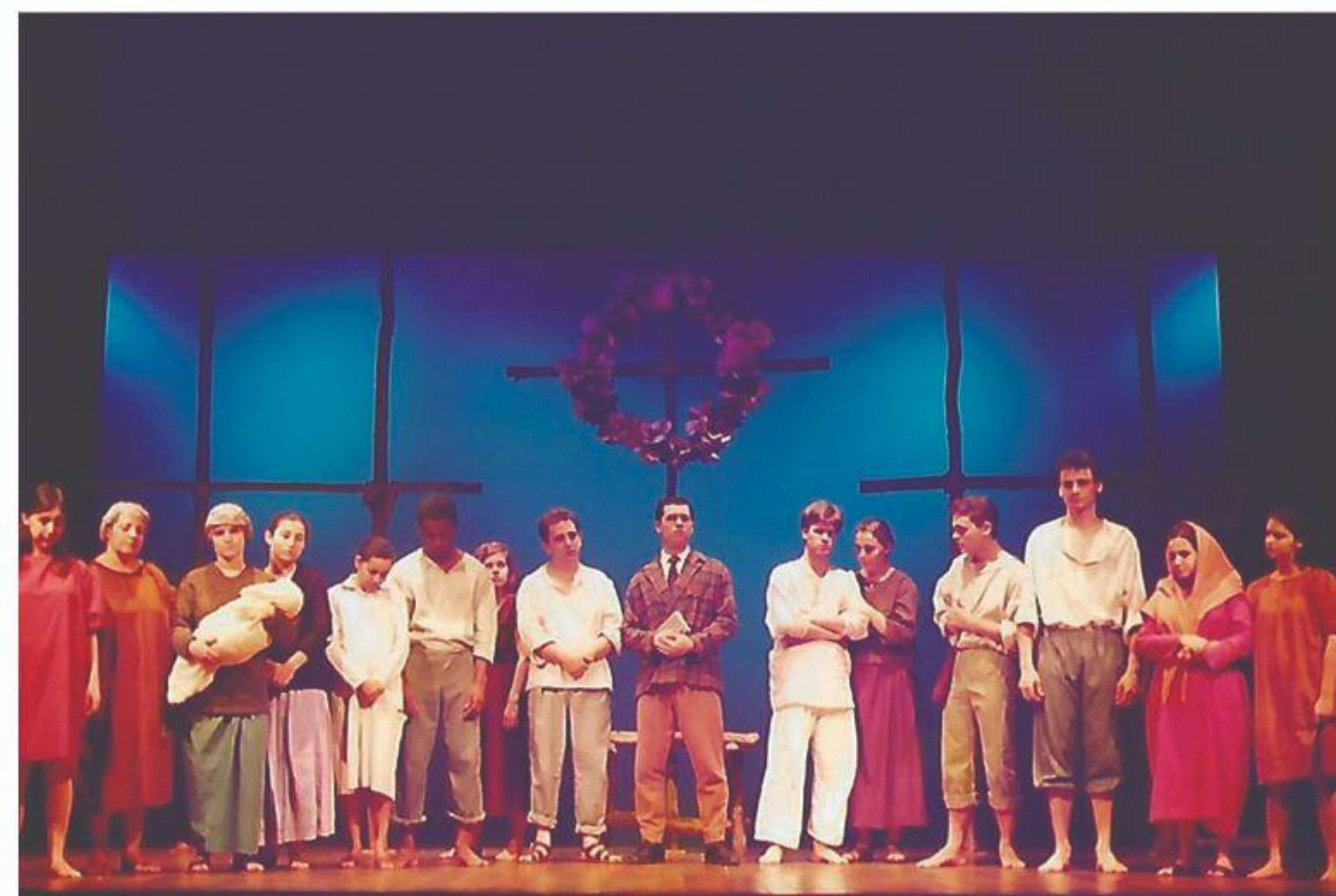
Vereda da Salvação (1992)

É sobre esperança. Verde que te quero verde.