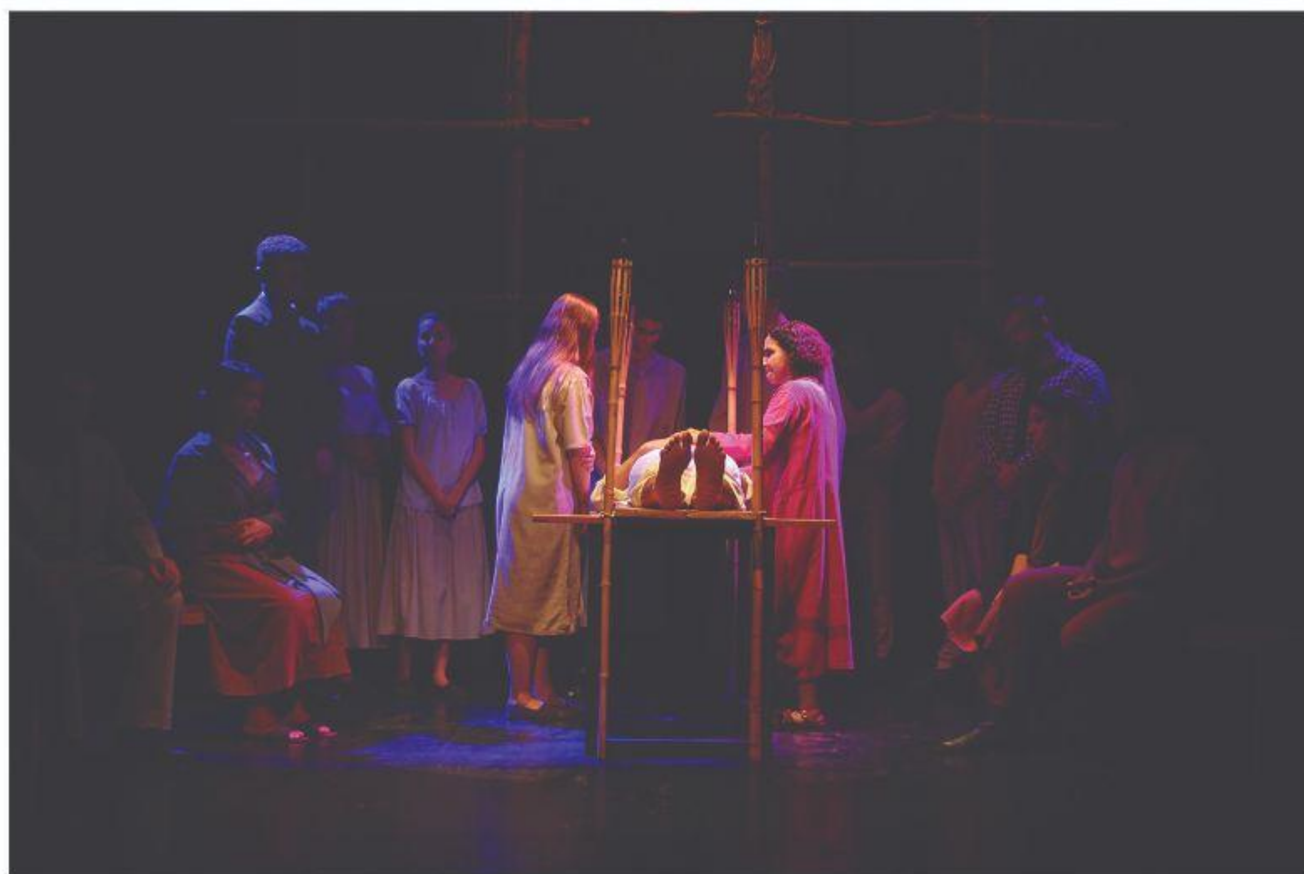
A dor da perda ( A bala de prata )