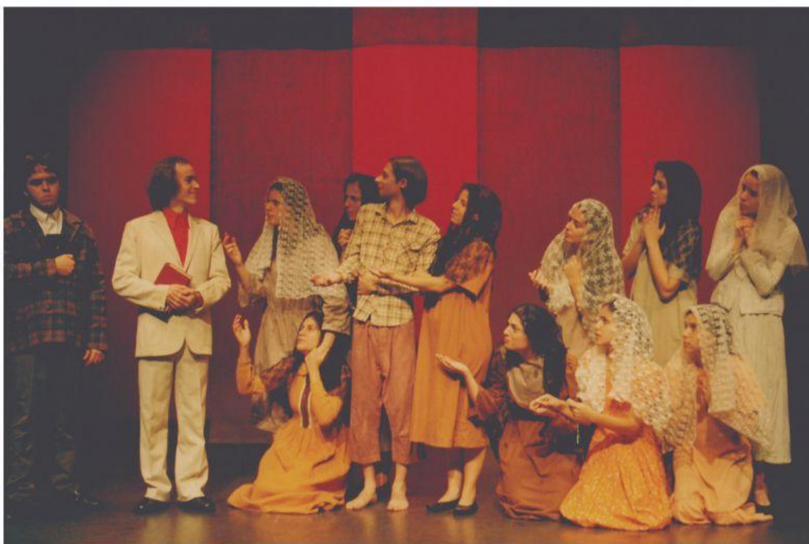
Zé das Cova e Dona Morte (2003)