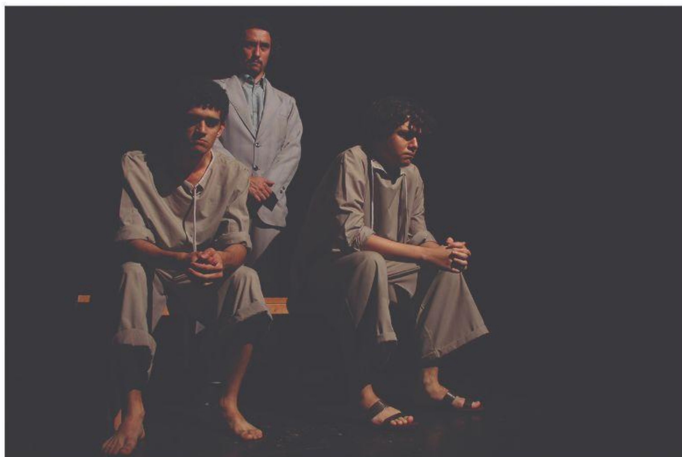
Os planos da vingança ( A bala de prata )