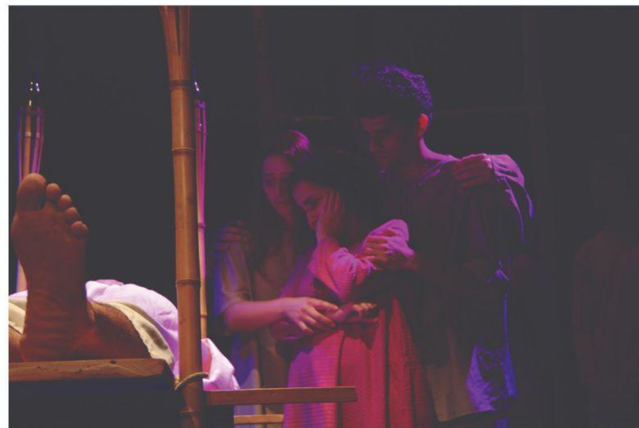
A despedida ( A bala de prata )