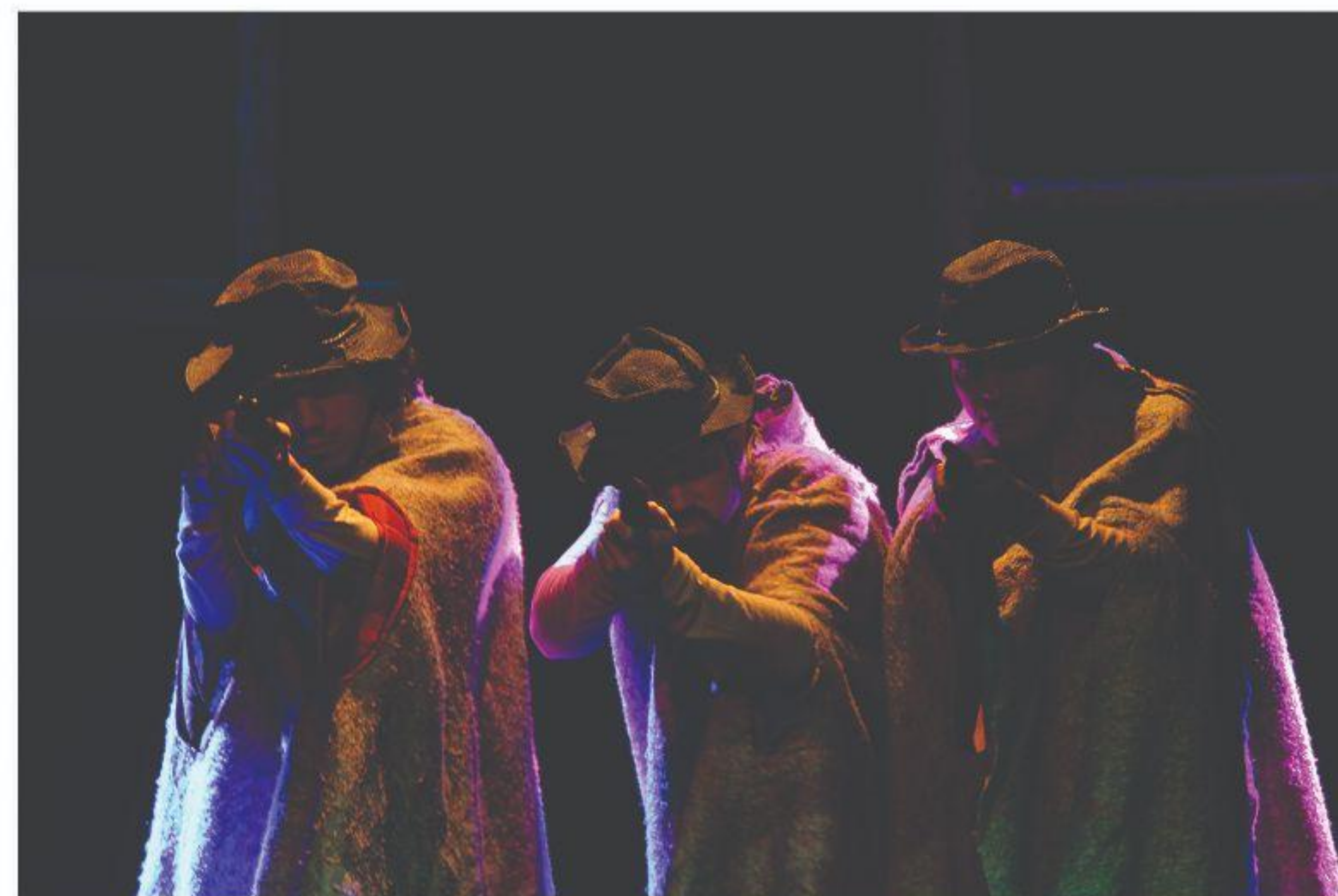
Matadores de aluguel ( A bala de prata )